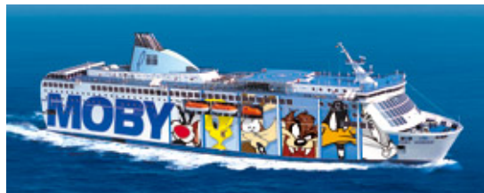
Traghetto Moby Wonder