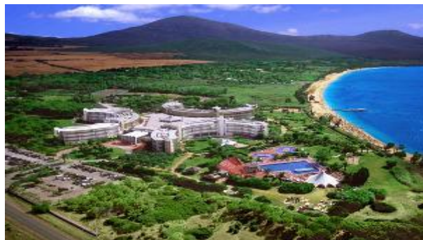
Villaggio Valtur Baia di Conte Alghero (SS)

Dal 22 al 24 maggio 07 – Pensione completa al Villaggio Valtur, bevande incluse ai pasti. Giornate libere a disposizione dei partecipanti per l'utilizzo alle innumerevoli attività d'animazione e strutture del Villaggio, comprese nella quota d'iscrizione. Il villaggio è pure dotato di centro benessere. Sarà inoltre possibile partecipare alle molteplici escursioni facoltative: