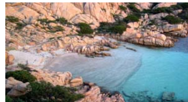
Caprera Cala Coticcio

Tour abbinato alle manifestazioni in occasione del bicentenario della nascita di Giuseppe Garibaldi 1807 – 2007