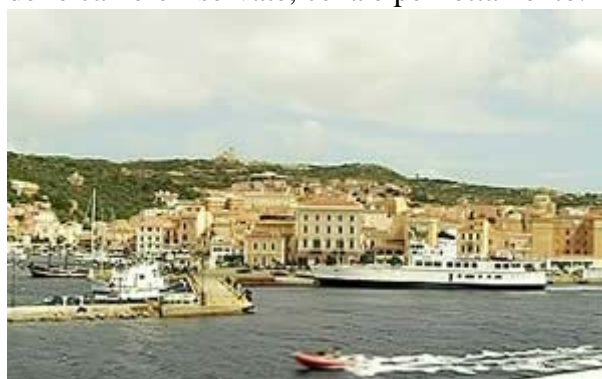
Porto della Maddalena

Lunedì 21 maggio 07 – Prima colazione libera a bordo. Ore 06.30 arrivo della nave al porto di Olbia, sbarco e trasferimento con mezzi propri a Palau. Parcheggio in apposita area di tutti i mezzi al seguito, imbarco sul traghetto prenotato della Enermar per la Maddalena, arrivo dopo circa venti minuti di navigazione. Giro orientativo della cittadina della Maddalena, a disposizione alcuni bus navetta riservati per gli spostamenti locali e per l'isola di Caprera, per visitare la casa museo di Giuseppe Garibaldi. Partecipazione alla cerimonia commemorativa dedicata all'eroe dei due mondi, programmata dalla F.A.S.I. e Autorità preposte. Pranzo organizzato nei migliori ristoranti della Maddalena. Pomeriggio libero a disposizione, per visite ai Musei ed escursioni facoltative in motobarca all'arcipelago della Maddalena: Spargi, Budelli, Razzoli, S. Maria ecc. Trasferimento dalla Maddalena per Palau. Subito dopo partenza per la Riviera del Corallo. Arrivo al Villaggio Valtur di Baia di Conte Alghero, assegnazione delle camere riservate, cena e pernottamento.