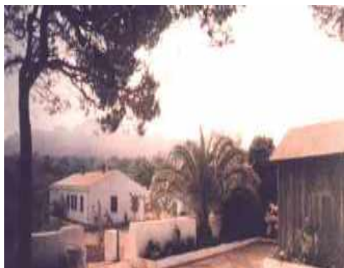
Caprera casa Museo G. Garibaldi